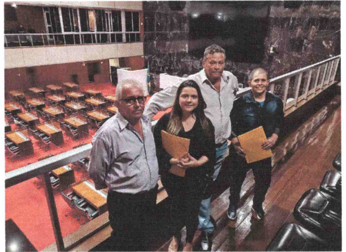
Registro fotográfico no plenário da Assembleia Legislativa de Minas Gerais.