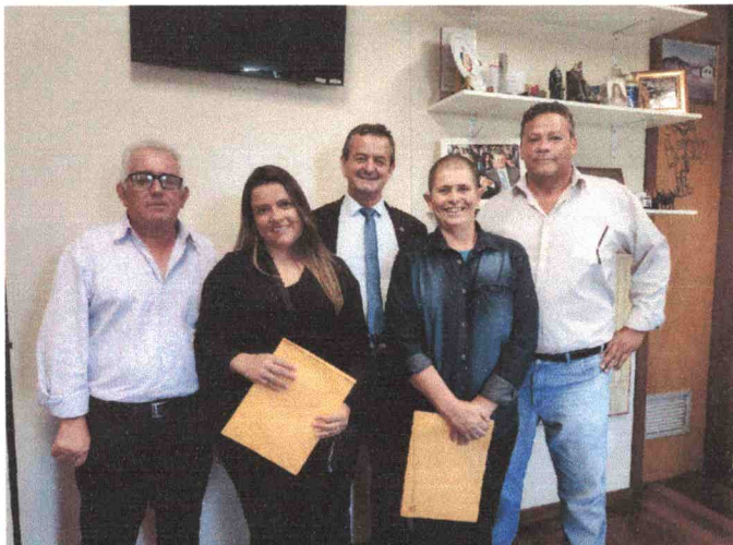
Reunião no Gabinete da Deputado Estadual Antônio Carlos Arantes.