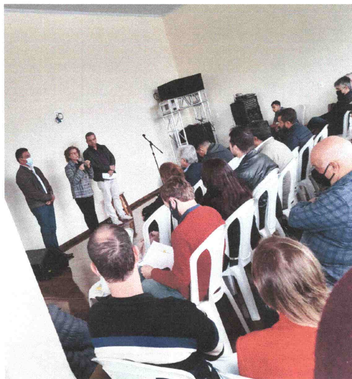
Reunião em Nova Resende - MG (10/06/2022).