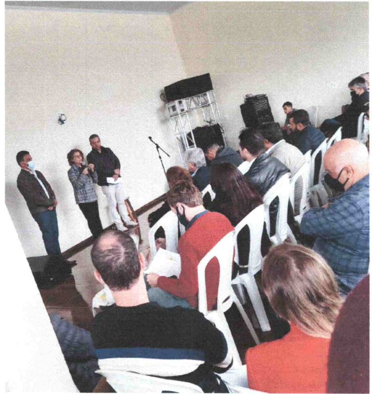
Reunião em Nova Resende - MG (10/06/2022).